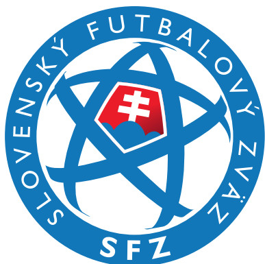
LOGO SFZ CIRCLE DARK