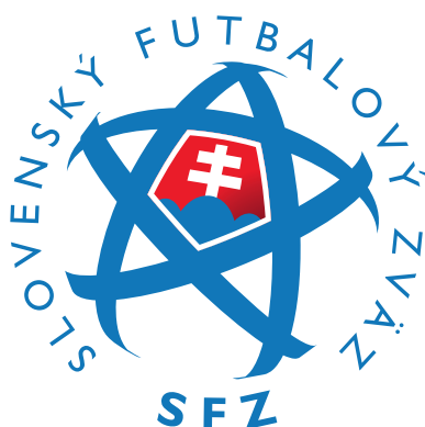
LOGO SFZ CIRCLE LIGHT